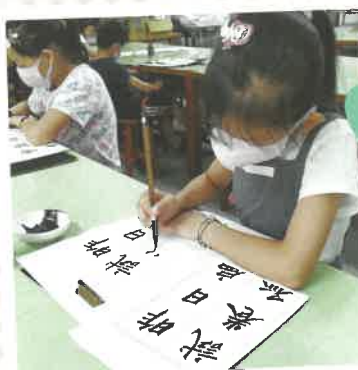
★學生參與書法培訓

其實我們都有機會成為身心障礙者的伯樂，當我們願意換個視角，陪伴他們找到自身的優勢能力，那麼原本令我們擔心的孩子，就多了一分因為放對位置而在專業領域大放異彩的希望。