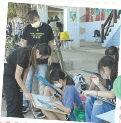
★學生參加淡水一信寫生比賽