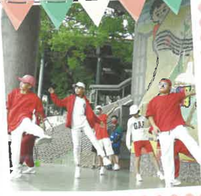
★兒童朝會熱舞表演