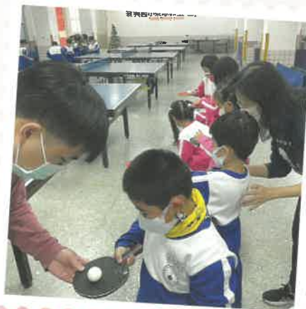
★一年級桌球體驗課程