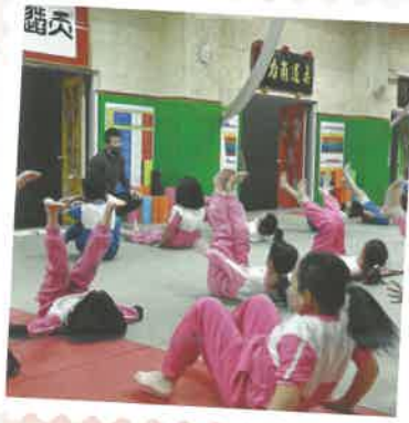
★新興柔道種子培訓